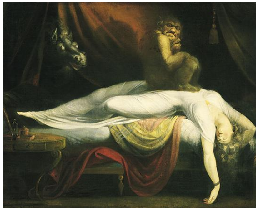
Le cauchemar, Johann Heinrich Füssli (1781)